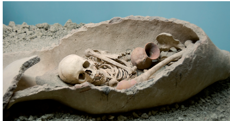
▲ Sepoltura di epoca Mesolitica, Antalya (Turchia).

Per attività interdisciplinari sulla religiosità nella preistoria si veda per es. www.licei-menano.it/site/nel/preist_04/religione%20bentagnolli/index.htm o sulle incisioni rupestri: www.rupestre.net/alps/valcamonica_ita.html